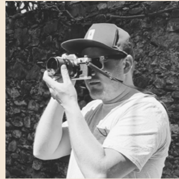
André Stummer @andrestummer

Unser Team setzt sich aus Menschen unterschiedlichen Alters zusammen, was uns eine breite Perspektive und eine Vielfalt an Ideen und Erfahrungen bietet. Wir sind stolz darauf, unsere fotografischen Fähigkeiten und Talente zu nutzen, um einzigartige und unvergessliche Momente festzuhalten.