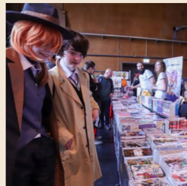
Besucher und Aussteller am Nerdyflohmarkt in Olten.