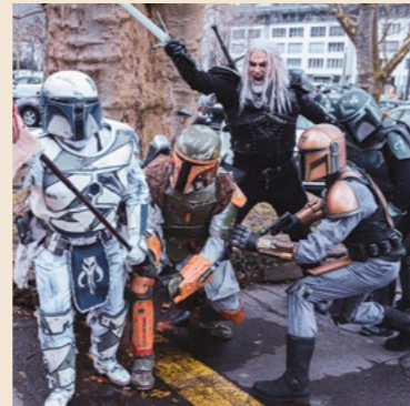
Swiss Witcher und andere Cosplayer am letzten Nerdyflohmarkt in Olten.

Sichtbarkeit in den sozialen Medien: Bereits im Vorfeld und während der Ausstellung sorgen unsere Blogger und Influencer auf ihren Kanälen mit Beiträgen für hohe Beachtung, was Ihnen zusätzliche Sichtbarkeit in den sozialen Medien verschafft.